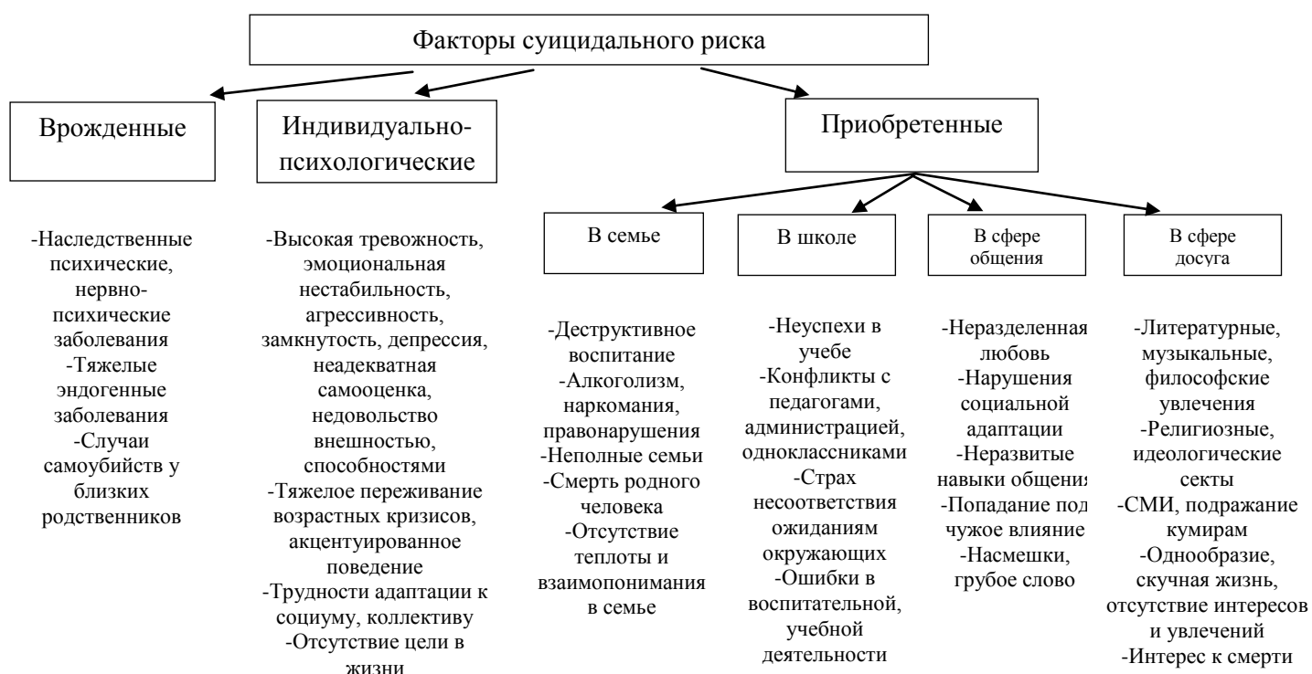
Рис.1. Факторы суицидального риска